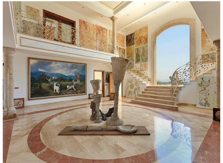
Panoramic window of the hall

All information is correct to the best of our knowledge. Errors and prior sale excepted. This prospectus is purely for information purposes. Only the notarized deed of sale is legally binding.