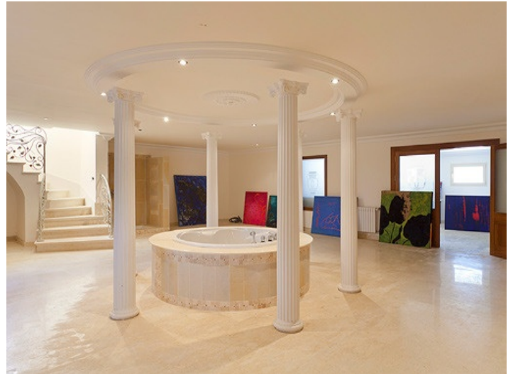
Spa zone on the souterrain