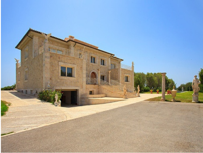
View of the mansion from the driveway