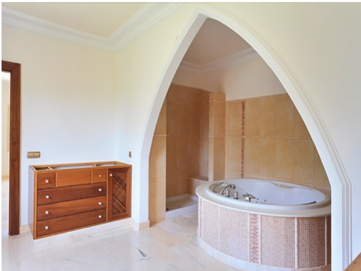
Jacuzzi in the main bathroom on the ground floor